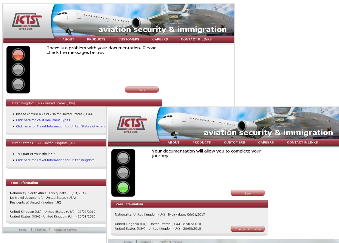
WebDoc 截图: TravelDoc 在线版