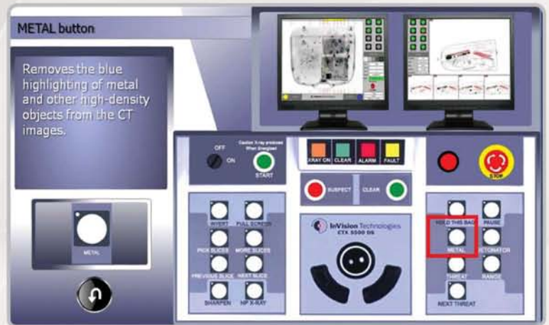
CTX Console Tour